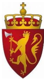
Olavs martyrøks i det norske riksvåpen