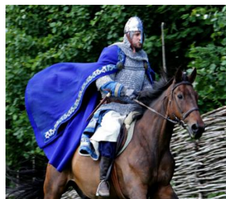
Spelet om Heilag Olav, Stiklestad