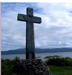
Krossen på Vetahaugen Møster