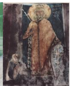
Olavsilde1100-tall Fødselskirken Betlehem