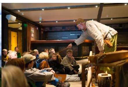
Vikingdager – Hundorp