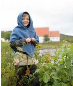
Vikingbarn Trondenes

Hensikten med spørsmålene er ikke å gi endelige svar, men å åpne for de viktige samtalene. Hvilke grunnpilarer er det norske samfunnet bygd på og hvilke skal bære det videre? Den norske grunnloven slår eksempelvis fast at «Verdigrunnlaget skal være den kristne og humanistiske arven vår». Samtidig vil verdier alltid utfordres, diskuteres og potensielt endres. Nasjonaljubileet 2030 foregår i et norsk samfunn i stor endring, og refleksjon rundt disse kjernespørsmålene vil ha stor samfunnsbetydning.