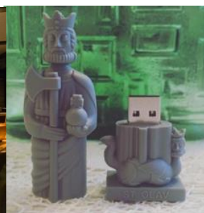
Olavsstatue som USB-brikke